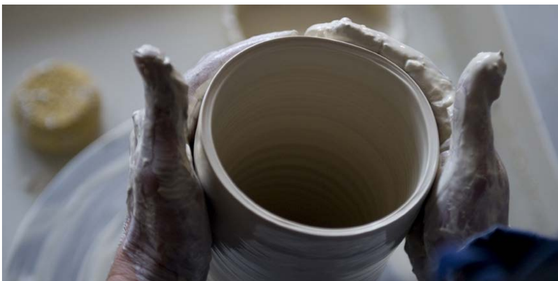
Photo © INMA : Emmanuelle Wittmann Céramiste © Augustin Detienne INMA