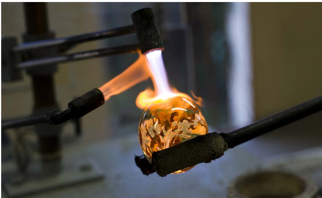
Verrerie de Soisy sur Ecole soufflage de verre

La France compte aujourd'hui plus de 1 000 établissements ou organismes de formation dédiés aux métiers d'art . Une diversité qui reflète la richesse du secteur. Des jeunes mais aussi de plus en plus d'adultes en reconversion peuvent y trouver leur orientation professionnelle, certains d'entre eux y découvrent même une vocation. Les métiers d'art sont des « professions passion » dont l'apprentissage requiert motivation et persévérance. Pour réussir, il faut beaucoup s'investir, diversifier les expériences et développer une certaine polyvalence en élargissant ses compétences à la gestion ou au design par exemple. Il existe diverses formations, la formation initiale permettant aux jeunes d'obtenir un diplôme et la formation professionnelle continue pour les adultes souhaitant se perfectionner, se reconvertir ou acquérir une qualification professionnelle ou un diplôme.