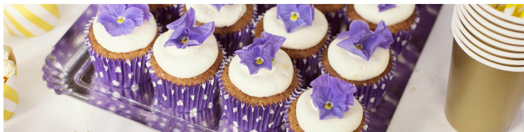
Piece of cake ! – 8 rue d'Aguesseau 69007 LYON – www.pieceofcake.fr

Nouvellement installée dans le quartier de la Guillotière à Lyon, la pâtisserie artisanale «Piece of cake !» propose aux restaurateurs tout comme aux particuliers, des pâtisseries fines, des spécialités anglo-saxonnes et des gâteaux d'anniversaire sur-mesure.