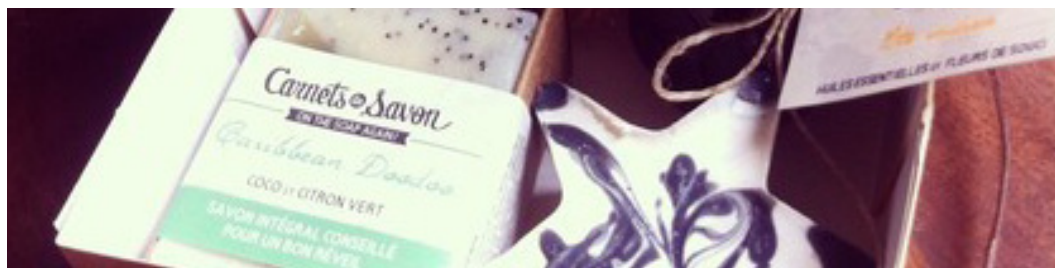
Carnets de savon – 103 bd de la croix-rousse 69004 LYON – www.carnetsdesavon.com

Marque de cosmétiques artisanale lyonnaise, «Carnets de savon» est née de la passion de sa savonnière pour la chimie, les plantes et les huiles végétales. Les produits, pour l'essentiel des savons, sont fabriqués à froid, et répondent aux critères des chartes de produits certifiés biologiques. Soucieux de votre bien-être, ces savons vous feront voyager à travers le monde..