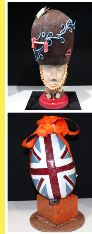
Concours du Plus Bel œuf de Pâques 2018

/ La remise des prix aura lieu à 17h le 6 avril sur le stand de la CMA du Rhône.