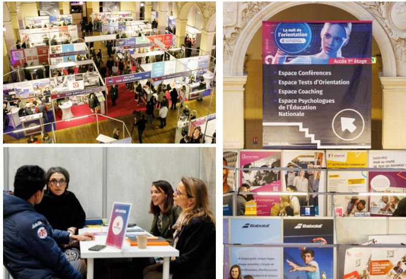
NDO : 20 janvier 2023